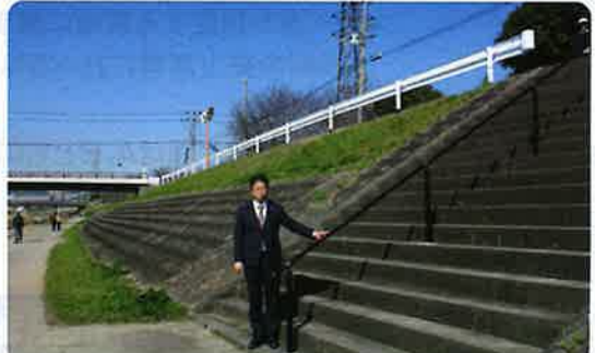
西河原1丁目 西河原橋の南側