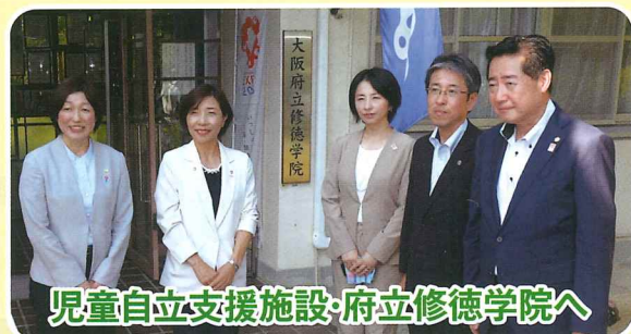
児童自立支援施設・府立修徳学院へ

施設の運営状況や課題など意見交換し「子どもたちが卒業後、社会で活躍できるよう府の支援を推進していきたい」と語った。