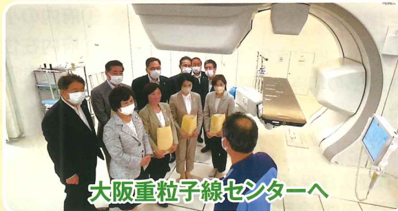
大阪重粒子線センターへ

施設の運営状況や課題など意見交換し「子どもたちが卒業後、社会で活躍できるよう府の支援を推進していきたい」と語った。