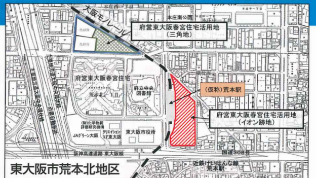
東大阪市荒本北地区

また、今後の三角地の活用方針と、買物弱者対策について確認したところ、通称「三角地」については、イオン跡地の公募内容の再検討を進めているところであるが、それと並行して市と連携し、地元の意見を丁寧に聞き、地域のまちづくりに資する土地利用が実現できるよう、活用方針を検討していく。また、買物弱者対策については、引き続き、さらなる利便性向上をめざし、地域住民のニーズも踏まえながら、移動販売の継続や販売商品の多様化など、事業者に働きかけていく。との回答を得、その上で、イオン跡地の公募については、三角地の活用方針なども含め、今後のスケジュール感を明確にするよう要望をおこないました。