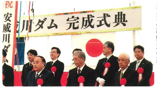
完成式典(中野は一番右)

今後は茨木市と協力しダム周辺の賑わいを創出し、愛され親しまれるダムを目指します!